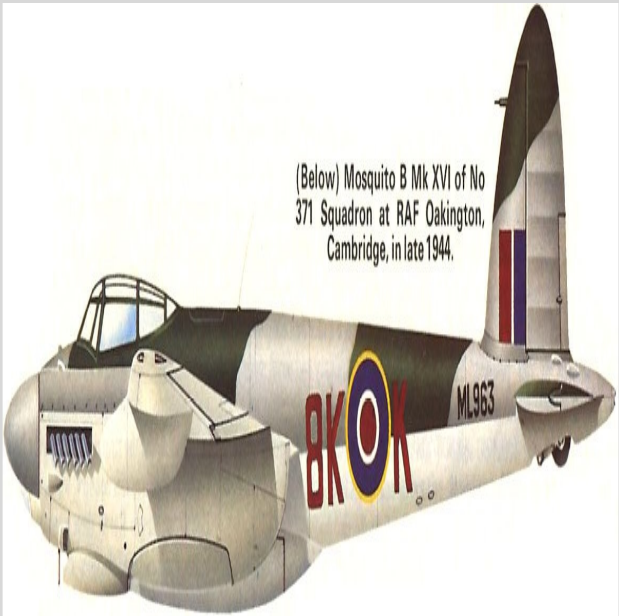
(Below) Mosquito B Mk XVI of No 371 Squadron at RAF Oakington, Cambridge, in late 1944.