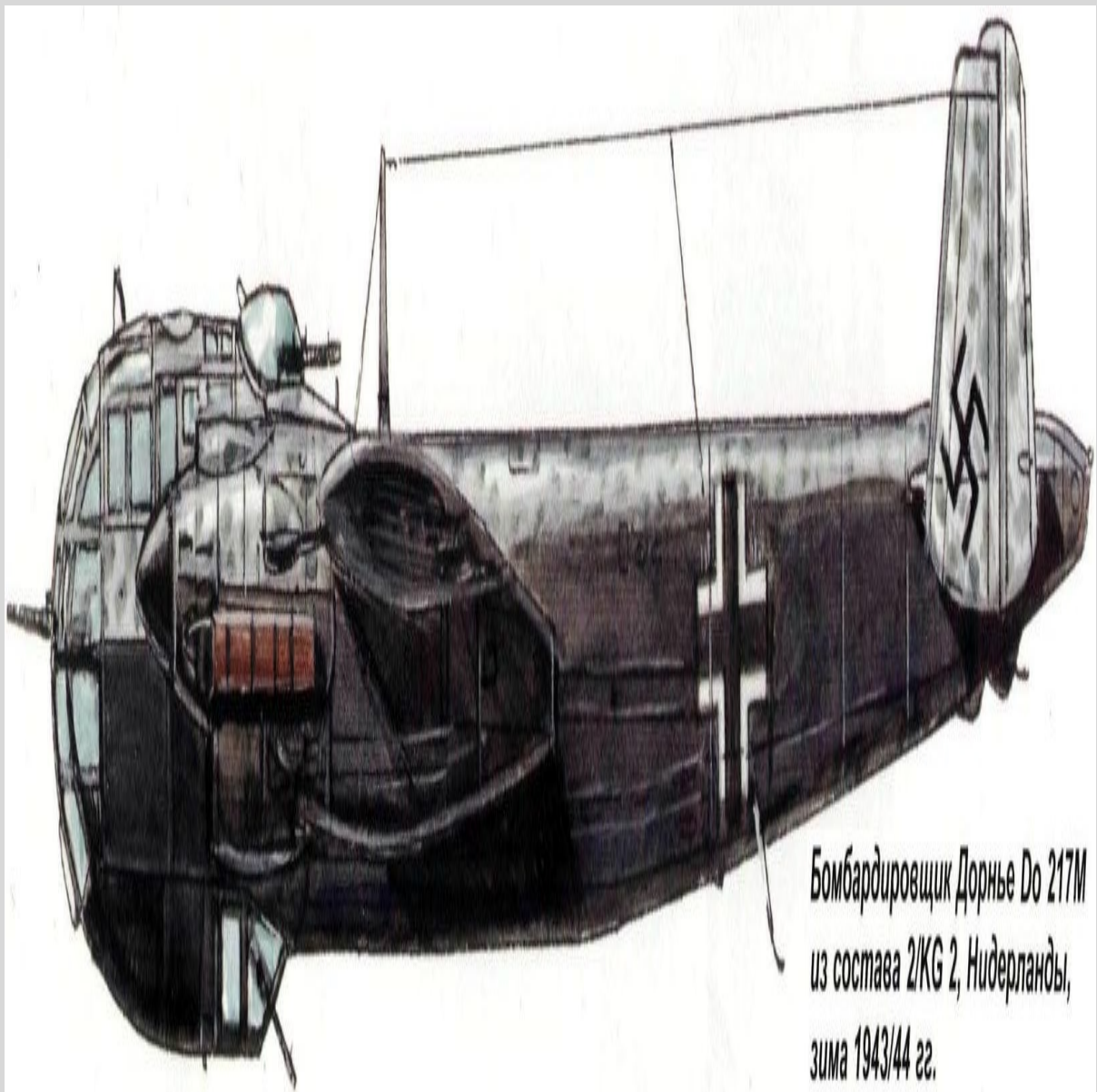
Бомбардировщик Дорнье До 217М из состава 2/KG 2, Нидерланды, зима 1943/44 гг.