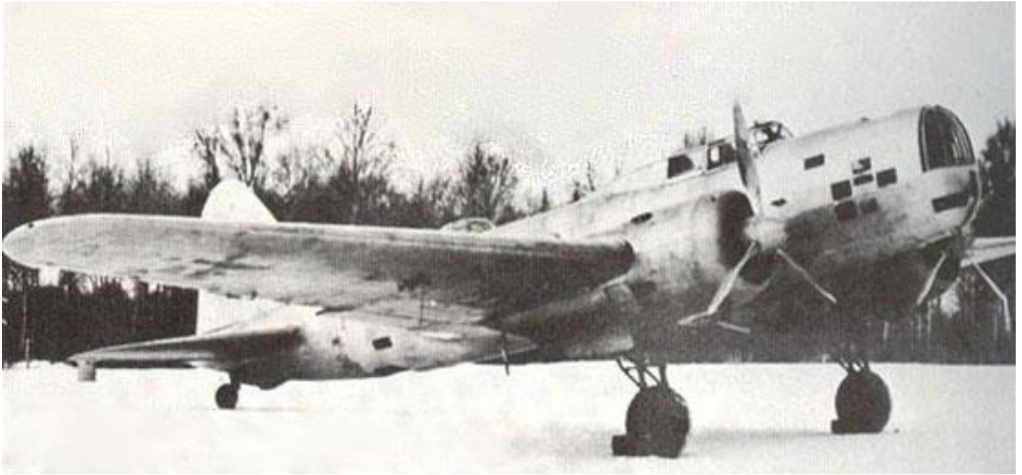
Iliouchine DB-3 vu de l'avant