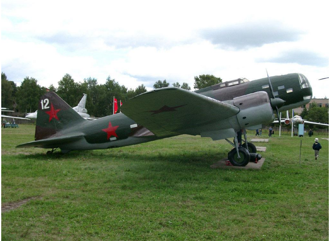
Iliouchine DB-3M à Monino